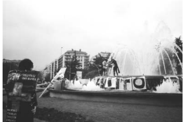
Protesta en Donostia