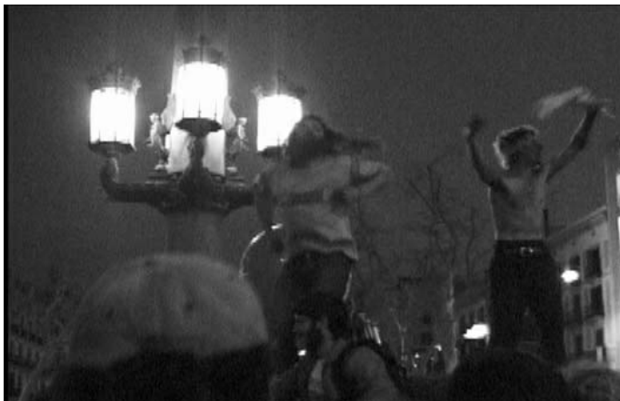
"Reclamando las calles" en Barcelona contra la Europa del Capital

Datozen egunetan eta hilabetetan espainiar estatuko herri mugimendu gehienek ehundaka deialdi helarazi diote jende orori datozen eraso neoliberaleri behar bezalako erantzuna emateko. Martxoaren 10an Plan Hidrologiko delakoaren aurka eta uraren inguruan beste kultura baten aldeko manifestazioa eginen da Baran. Zenbait iturrien arabera 300.000 lagun inguruk hartuko du parte ekitaldi honetan. Ekitaldi honek girotu eta berotuko du datorren asterako programa zalantzarik gabe.