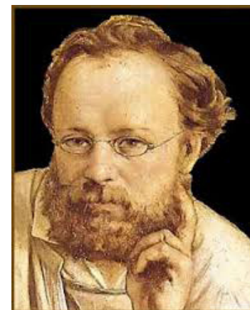
Pierre-Joseph Proudhon, 1809 - 1865

No cabe duda para todo observador sincero de la situación actual y de las causas que la originaron, que el maniobrar con conceptos absolutistas, en el campo socialista, no sólo quebrantó la fuerza de resistencia del movimiento socialista en muchos países, y sobre todo en Alemania, sino que favoreció, espiritualmente, la reacción fascista. Porque el socialismo o ha de ser libre o no existirá.