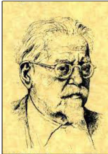
Rudolf Rocker, 1873 - 1958