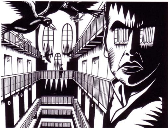
En Au Pied du Mur. L'Insomniaque, 2000

J.M. Solé y J. Villarroya, "La repressió a la reraguarda de Catalunya, 1936-1938". Abadía de Montserrat, 1989