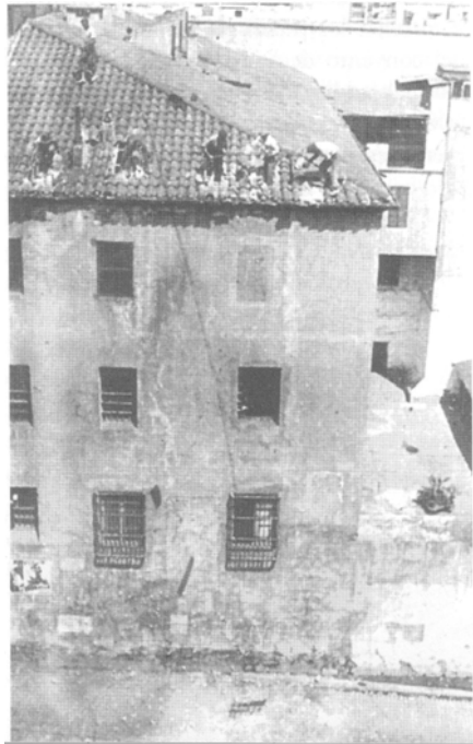
Dstrucción de la cárcel de mujeres en 1936

tenciarios españoles por imperar en ellos como único régimen aplicable o aplicado el de aglomeración, con su cohorte inseparable de vicios, podredumbre, miseria y hasta crímenes. Por fortuna en Barcelona semejante estado de cosas va a sufrir radical transformación en méritos del acontecimiento que hoy celebramos. Lo que quizás en toda propiedad podría calificarse de peor entre lo malo, va a ser sustituido, según opinión autorizada, por lo mejor entre lo bueno. La nauseabunda cuadra va a ser sustituida por la higiénica celda con instalación sanitaria completa; el patio asqueroso y corruptor por el reglamentario paseo celular, (...). El principio capital y fundamental adoptado en la construcción de esta nueva cárcel ha sido el de establecer en ella el régimen de aislamiento, de manera que si se preguntara ¿Qué es la nueva cárcel de Barcelona? Podría contestarse con toda propiedad: una prisión celular.”